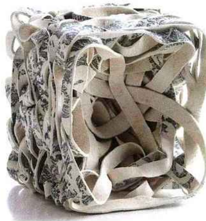
Daniela Schagenhauf, Résonance II, 2010, porcelaine, H. 22 cm (galerie Collection, Paris.).

Renseignements au 01 44 01 08 30 et sur www.circuits-ceramiques.fr « Exposition de l'Académie Internationale de la Céramique » et « La scène française contemporaine », Sèvres-Cité de la céramique - 2, place de la Manufacture, 92310 Sèvres (01 46 29 22 00 - www.sevresciteceramique.fr ) ; du 15 septembre au 10 janvier. « La scène française contemporaine », Les Arts Décoratifs - 107, rue de Rivoli, 75001 Paris (01 44 55 57 50 - www.lesartsdecoratifs.fr ) ; du 17 septembre au 20 février. « Territoires en mouvement », galerie Collection - 4, rue de Thorigny, 75003 Paris (01 42 78 67 74) ; du 14 septembre au 20 novembre.